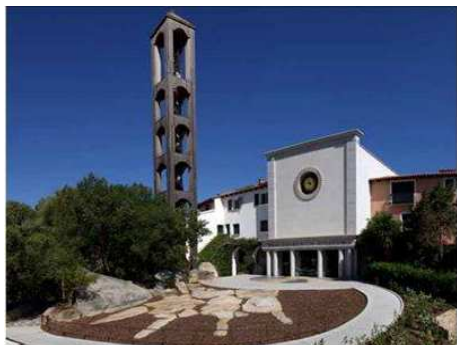
CHIESA DI SAN LORENZO